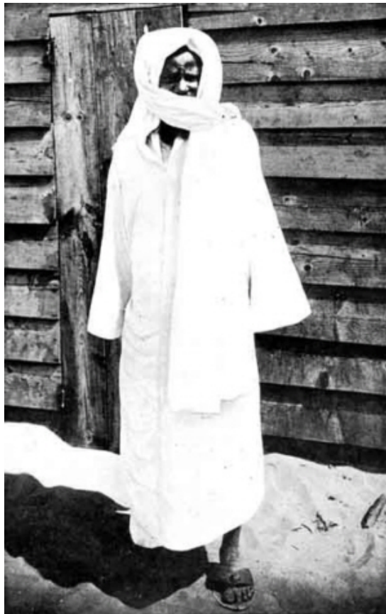
Cheikh Ahmadou Bamba

Cheikh Ahmadou Bamba, est aujourd'hui plus que jamais la référence et l'échelle des valeurs pour toute personne qui aspire à la quiétude ici bas et dans l'au delà.